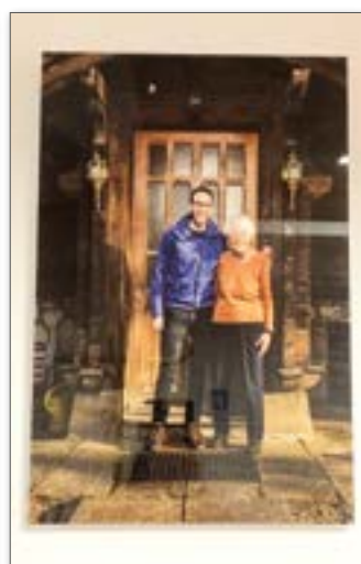
L'art de cohabiter entre générations